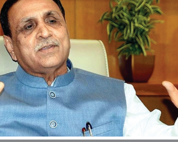
ગુજરાત | વંદન