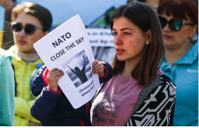
જેવી યાતના આપી હતી. અનેક શબોના ફાંસીએ લટકાવ્યાના ગળામાં નિશાન તો માથા પર ગોળી મારીને કે ગળુ દબાવીને માર્યાના નિશાન મળી આવ્યા હતા.