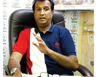
ગુજરાત | વંદન | અખબારમાં

■ ભાજપને ફાયદો કરાવવા 'બી' ટીમ તરીકે આપ પાર્ટી મેદાનમાં આવી : ઇમરાનનો ઈશારો