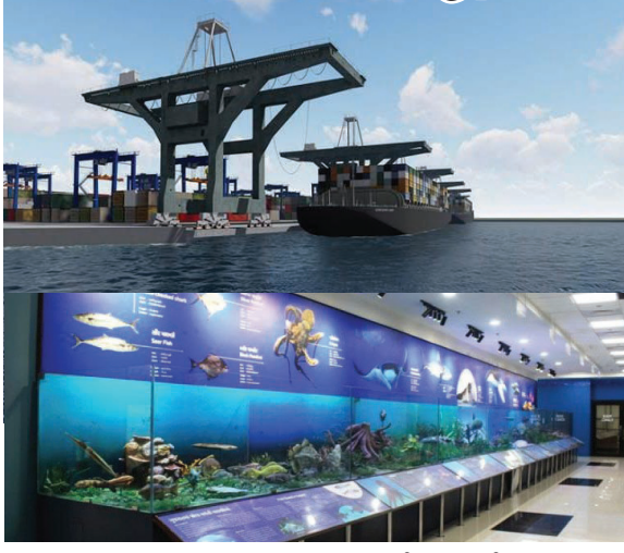
પ્રવાસ દરમ્યાન વડાપ્રધાન નરેન્દ્ર મોદી રાજ્યના અન્ય 3472.54 કરોડના વિકાસકામોનું ખાતમુહૂર્ત-લોકાર્પણ કરશે તેમાં પાણી પુરવઠા, ડ્રેનેજ, ડ્રીમસીટી જેવા પ્રોજેક્ટોનો સમાવેશ થાય છે.

કહ્યું કે આ પોર્ટની ક્ષમતા 5થી6 મીલીયન મેટ્રિક ટનની હશે. બ્રિટન સ્થિત ફોરસાઈટ યુપ તથા પત્રનાભ મફતલાલ યુપની ખાનગી માલિકી હતી.