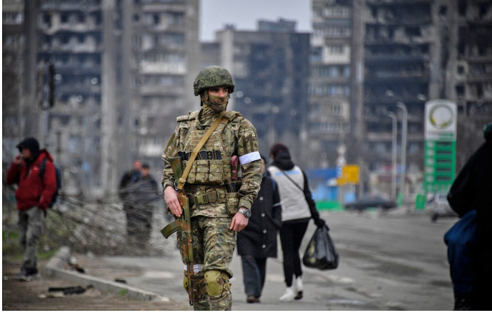
રશિયન સૈનિકોએ 4 વર્ષની બાળકીથી માંડીને 82 વર્ષની વૃદ્ધા સાથે યૌન હિંસા આચર્યી હોવાનો ચોંકાવનારો ખુલાસો થયો છે. સંબંધીઓની સામે જ રશિયન સૈનિકોએ

હેલા સાત મહિનાથી વધુ સમયથી યુક્રેન પર રશિયાના હુમલા દરમિયાન રશિયન સૈનિકોએ યુક્રેનમાં નાગરિકો પર યૌન હિંસા સહિતની યાતનાઓ ગુજારી હોવાનો ચોંકાવનારો ખુલાસો સંયુક્ત રાષ્ટ્રના રિપોર્ટમાં થયો છે. યુક્રેનમાં રશિયા દ્વારા કરવામાં આવેલ કથિત અપરાધોની તપાસને લઈને રચાયેલા પંચનું કહેવું છે કે યુક્રેનમાં રશિયન સૈનિકોએ ભીષણ અત્યાચાર કર્યા છે, આયોગની ટીમ એ જવાબે ગઈ હતી અને પુછપરછ કરી હતી. તપાસ રિપોર્ટમાં કહેવામાં આવ્યું છે કે સૈનિકોએ નાગરિકોની વસ્તીવાળા વિસ્તારમાં બોમ્બમારો કર્યો હતો. લોકોને ફાંસી આપી હતી, યાતના આપી હતી અને યૌન હિંસા પણ આચર્યી હતી.