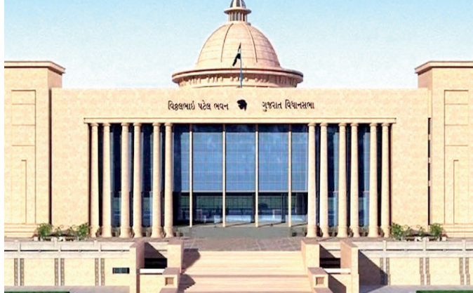
હિમાચલપ્રદેશની સાથે રાબેતા મુજબ રાજ્યસભાની ચૂંટણીમાં અહમદ પટેલને પૂરે વેરેલા વિનાશનું કારણ આગળ ધરીને ગુજરાતની અલગથી ચૂંટણીઓ યોજાય તે પહેલાં માર્ચ-2017માં યોજાયેલી ચૂંટણીઓમાં ચોમાસાના હવાવવા કોંગ્રેસમાંથી એક પછી એક એમ 14 ધારાસભ્યોના રાજીનામાથી

ત્રણ દિવસીય પરિષદ, લેઉવા પાર્ટીદાર મતો માટે ખોડલધામના નરેશ પટેલને પોતાની તરફ લાવવાના પ્રયાસો, ગુજરાતમાં કોંગ્રેસના 10 ધારાસભ્યો આધાપણ થઈ શકે એવી રાજસ્થાનના સીએમ અશોક ગેહલોતની આવબેલ, કોંગ્રેસના 20 ધારાસભ્યો દ્વારા રાહુલ ગાંધીને મળવા માટે લખાયેલો પત્ર, પાર્ટીદારો સામેના કેસો પાછા ખેંચવાની સરકારી કવાયત, પંજાબ જીત્યા બાદ ગુજરાતમાં આપ પાર્ટીનો મોદીની જેમ કેજરીવાલના ભવ્ય રોડ શોનું આયોજન આ તમામ સમય-સંજોગો એવો ઈશારો કરે છે કે ગુજરાતમાં ગમે ત્યારે ચૂંટણીઓ આવી શકે છે...! 2017માં ડિસેમ્બરમાં ગુજરાત વિધાનસભાની ચૂંટણીઓ