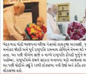
બેઠક બાદ મોદી ભાજપના વરિષ્ઠ નેતાઓ લાલકૃષ્ણ અહવાણી, મુરલી મનોહર જોશી અને પૂર્વ રાષ્ટ્રપતિ રામનાથ કોવિંદને તેમના મહેતુ મળ્યા હતા. આ પછી પીએમ સાંજે 6 વાગ્યે રાષ્ટ્રપતિ ડોહરી મુરુમને મળવા પહોંચ્યા. રાષ્ટ્રપતિએ તેમને સરકાર બનાવવા માટે આમંત્રણ આપ્યું. આ પછી મોદીએ ક્યુ કે 18મી લોકસભા નવી ઊંઠા અને કોઈક કરવાની લોકસભા હશે.

17 સપ્ટેમ્બર, 2024ના રોજ 75મા વર્ષમાં પ્રવેશ કરનાર નરેન્દ્ર દામોદરસિંહ મોદીના જન્મનાં વડાપ્રધાનપદના શપથગ્રહણની વ્યૂ એક તારીખ ઉમેરવા જઈ રહ્યા છે અને તે તારીખ છે 9 જૂન, 2024. આ અંગુઠા 26 મે 2014ના રોજ તેઓ પહેલીવાર વડાપ્રધાન બન્યા હતા અને 30 મે 2019ના રોજ બીજી વાર વડાપ્રધાન બન્યા હતા અને હવે સતત ત્રીજાવાર વડાપ્રધાનપદના શપથગ્રહણ કરવા જઈ રહ્યા છે. તે સાથે ભારતના રાજકીય ઇતિહાસમાં એક નવું અધ્યાય લખાવા પાર લાગે છે. કેમ કે પરિશ્રામભરે ભારતના રાજકીયમાં અને રાજકીય પક્ષમાં ભારે અપરિચિત સંસ્કાર આવવા પડે તેનો પ્રથમ વડાપ્રધાન નેહરુની સમજણના બની શક્યા ત્યાં કેમ કે ત્રીજી વાર મોદી દેશવાણી કે ગઠબંધનની સરકારના વડાપ્રધાન બનવા જઈ રહ્યા છે. અને 2024ના લોકસભાના પરિણામોમાં જ જાનિટર નિતિશની આગેવાઈ છે તેમ લોકોને ભાજપ અને મોદીને આકાશમાંથી નીચે ઉતાર્યા છે અને હવે તેની ટેકાની સરકારને ચલવાનું ના પડ્યું અને નિતિશકુમારની ગઠબંધનને મંજૂરી આપી. જેટલેસ પ્રમુખ દુભાસ્વામીએ પ્રસ્તાવને ટેકો આપ્યો હતો આ પછી TDP નીકે વંદનાબુ નાયડુ, JDU નીકે અને બિહારના સોમિય નિતિશ દુમારે સમર્થન જાહેર કર્યું હતું. મોદી