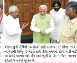
વંદનાબુની જેટીપી 16 બેઠકો સાથે ગઠબંધનમાં બીજા નંબર અને નીતિશની જેટીપી 12 બેઠકો સાથે ત્રીજા નંબરની સોથી મોદી મોટી છે. આ સમયે ભાજપ માટે બંને પક્ષો જુદી રી. તેમના વિના ભાજપ માટે સરકાર બનાવવી મુશ્કેલ છે.

રોમી રેલવે ડિવિઝનના લોકો પાપલટ એએસપી લિલિંકે વડાપ્રધાન નરેન્દ્ર મોદીના શપથ ગ્રહણ સમારોહમાં હાજરી આપવાનું આમંત્રણ મળ્યું છે. તે રાંચી-હાવલ અને રાંચી-વાલસાહી વંદે ભારત આદિવાસી પાર્લિટરની શાંતિમાં પણ છે. તેઓ પોતાની પત્ની સામાજિક કાર્યકરે વેદી દીર્ઘ સાથે શુભવરે દિલ્હી પહોંચ્યા હતા. તે બિરસા ટોલ પાસે રહે છે. ક્યુ કે આ કાર્યકર્મમાં આમંત્રણ શરૂ કરવાની વાત છે. તેનાથી નમનાં કોલકા અને કામમાં ઉર્જા આવે છે. આ કાર્યકર્મ માટે દેખાવમાંથી 10 શ્રેણી લોકો પાલિટરને યોગદાનમાં આવા છે. એએસપી લિલિંકે ક્યુ કે તેમને સ્વાસ્થ્ય વિભાગનું ન હતું કે તેમના જેવા સામાન્ય રેલવે કર્મચારીને ક્યારેય માટલા માટે કાર્યકર્મમાં ભાગ લેવા માટે મોલાવવામાં આવે. તેથી ક્યુ કે તે હંમેશા પોતાના કામ પ્રયે ઓભાવર રહ્યા છે.