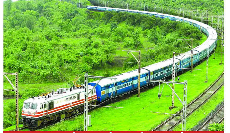
અમદાવાદથી મુંબઈ અને મુંબઈથી અમદાવાદ ટ્રેન

ટ્રેન નંબર 09141 અને 09414નું બુકિંગ 13 જાન્યુઆરી, 2023થી પેસેન્જર રિઝર્વેશન સેન્ટર્સ અને IRCTC વેબસાઈટ પર શરૂ થશે. ટ્રેનના સમય, સ્ટોપેજ અને કમ્પોઝિશન વિશે વિગતવાર માહિતી માટે મુસાફરો enquiry.indianrail.gov.inની મુલાકાત લઈ શકે છે.