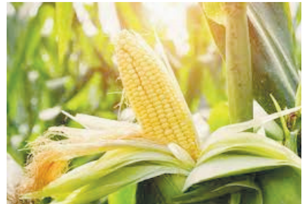
પ્રોડક્ટ તરીકે અંદાજીત 135 કેટીપીએ જેટલું પ્રોટીન રિચ એનિમલ ફીડ અને 17 કેટીપીએ જેટલું કોર્ન ઓઈલ પ્રાપ્ત થશે.

આગામી હિવસોમાં ગુજરાતના ખેડૂતો મકાઈ અને ચોખાની ભૂકી વેચીને સારી કમાણી કરી શકશે, કારણ કે ગુજરાતમાં 500 કેએલડીની ક્ષમતાવાળો બાયો ઇથોનેલ પ્લાન્ટ સ્થાપવા જઈ રહ્યો છે. ગુજરાતના ખેડૂતોને પ્રત્યક્ષ રીતે આનાથી ફાયદો થશે. આ પ્લાન્ટની સ્થાપના માટે અંદાજે 1000 કરોડનું રોકાણ થશે.