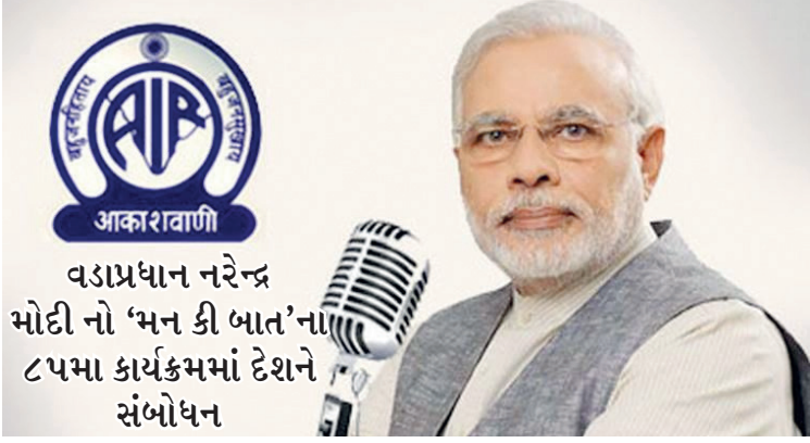
વડાપ્રધાન નરેન્દ્ર મોદી નો 'મન કી બાત'ના ૮૫મા કાર્યક્રમમાં દેશને સંબોધન

વડાપ્રધાન નરેન્દ્ર મોદીએ રવિવારે 'મન કી બાત'ના ૮૫મા કાર્યક્રમમાં દેશને સંબોધન કર્યું હતું. વડાપ્રધાનને મન કી બાતમાં ભ્રષ્ટાચારનો મુખ્ય ઊભાવતા જણાવ્યું કે, દેશ ઝડપથી આગળ વધી રહ્યો છે. એવામાં ભ્રષ્ટાચાર ઊધઈની જેમ દેશને ખોખલો કરી રહ્યો છે, પરંતુ તેનાથી મુક્તિ માટે ૨૦૪૭ સુધી રાહ શા માટે જોવી જોઈએ?