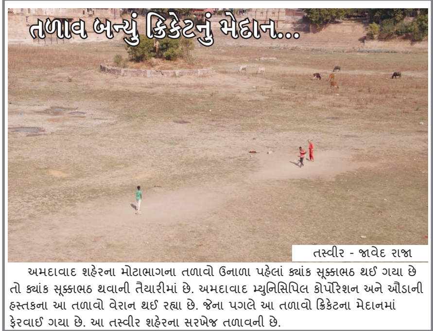
તળાવ બન્યું કિકેટનું મેદાન...

2-3 મહિલાઓ સામે પાસાની કાર્યવાહી કરાશે, મહિલાઓ ધરમાં જ ચલાવતી હતી દારૂનો ધંધો