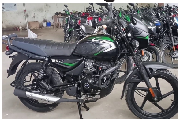
માહિતી મુજબ બજાજ ઓટો તેના ટુ વ્હિલ્સના વેચાણ સાથે થયેલા વધારામાં કાચા માલનાં ભાવની અસામાન્ય વૃદ્ધિ કારણભુત છે.

કંપનીની આવક 16.4 ટકા જેટલીવધીને 10202.80 કરોડની સપાટીએ પહોંચી છે. કંપનીએ 1144403 યુનિટ ટુ વ્હિલ્સનું વેચાણ દર્શાવીને પ્રથમ ત્રિમાસિક સમયગાળામાં 933643 યુનિટનું હતું. વ્યાજ, કરવેર અને એમોટાઈઝેશન પુર્વેનો નફો 25.5 ટકા વૃદ્ધિ પામીને 1759 કરોડની સપાટીએ પહોંચ્યો છે. કંપનીનો નિર્માસિક સમયગાળામાં તેના ચોખ્ખા નફામાં 20 ટકાની વૃદ્ધિ હાંસલ કરી અને રૂ. 1530 કરોડનો ચોખ્ખો નફો પ્રાપ્ત કર્યો છે. કંપનીની આવક 16.4 ટકા જેટલીવધીને 10202.80 કરોડની સપાટીએ પહોંચી છે. કંપનીએ 1144403 યુનિટ ટુ વ્હિલ્સનું વેચાણ દર્શાવીને પ્રથમ ત્રિમાસિક