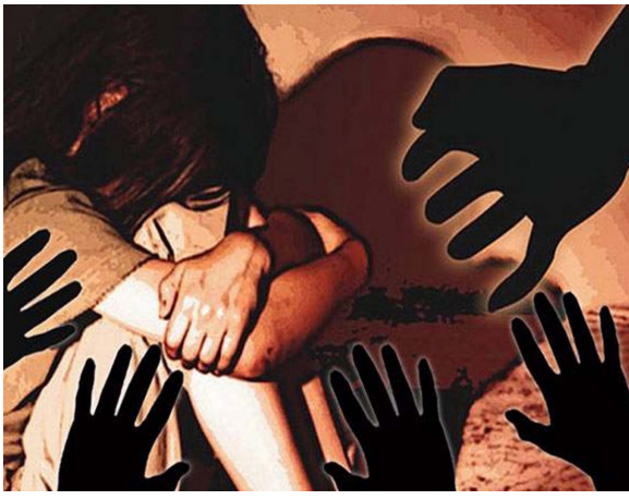
લોખંડનો સળીયો નાખ્યો હતો, બાદમાં આરોપીઓએ મહિલાને આશ્રમ રોડ પર ફેંકીને ફરાર થઈ ગયા હતા, હાલ મહિલા ગંભીર છે.

દિલ્હીમાં વધુ એકવાર નિર્ભયા કાંડ સર્જાયો છે, જેને લઈને દિલ્હી ફરી એક વખત શરમજનક સ્થિતિમાં મુકાયુ છે. દિલ્હી એનસીઆરમાં સંપતિના વિવાદમાં એક મહિલાનું અપહરણ કરી ગાઝીયાબાદમાં બે દિવસ સુધી તેના પર ગેંગરેપ આચરવામાં આવ્યો હતો, આરોપીઓએ હેવાનિયતની તમામ હદો પાર કરી મહિલાના પ્રાઈવેટ પાર્ટમાં