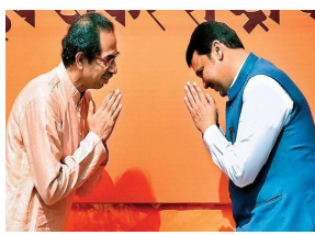
ગુજરાત | વંદન

થવાની શક્યતા બહુ ઓછી છે. 4. ગુઆમ | નાના પેસિફિક ટાપુની વસ્તી લગભગ 168,000 છે, પુષ્કળ જગ્યા છે અને કોઈ દુશ્મન નથી. તેની પાસે ખૂબ જ નાની સૈન્ય છે, જેમાં માત્ર 1,300 સભ્યો છે, જેમાંથી માત્ર 280 જ પૂર્ણ-સમય છે, તો શા માટે કોઈ આવી જગ્યા પર હુમલો કરવાનું પસંદ કરશે. તે કોઈને માટે કોઈ ખતરો નથી અને યુદ્ધમાંથી ભાગી રહેવા કોઈપણ માટે સંપૂર્ણ સલામત આશ્રયસ્થાન હશે. 5. ઓસ્ટ્રેલિયા | પર્ય, ઓસ્ટ્રેલિયા. વેસ્ટર્ન ઓસ્ટ્રેલિયાની રાજધાની કોઈપણ રાજકીય કેન્દ્રથી એટલી દૂર છે કે તે માની લેવું સલામત રહેશે કે તે કોઈના વિનાશની સુધિમાં સામેલ થશે નહીં. તેની વસ્તી 2 મિલિયનથી વધુ છે, અને ઘણા લોકોને રાખવા માટે પૂરતી જગ્યા છે. વસ્તીમાં ખરેખર અન્ય ઘણા દેશોના લોકોનો સમાવેશ થાય છે, જેમાં 40% અંગ્રેજ, 9.2% સ્કોટિશ અને 1% વેલ્શનો સમાવેશ થાય છે - તેથી ત્યાં દરેકનું સ્વાગત છે. 6. ઈઝરાયેલ | અને અંતે, જો પરમાણુ યુદ્ધ ફાટી નીકળે, તો ઈઝરાયેલ તમારા બચવા માટેના સ્થળોની યાદીમાં ટોચ પર રહી શકે છે. તેમાં વિશ્વના દરેક મોટા ધર્મના પવિત્ર સ્થાનો હોવાથી, તે કહેવું સલામત છે કે મધ્ય પૂર્વીય રાષ્ટ્ર વિનાશની સુધિમાંથી સુરક્ષિત રહેશે. તે ઘણી ભૂભાગ ટનલ અને સલામત આશ્રયસ્થાનોનું ઘર પણ છે.